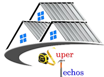
LÁMINA STANDING SEAM ROOF (SSR)